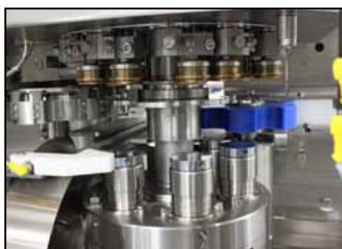
Zone de sertissage conçu selon spécification d'hygiène