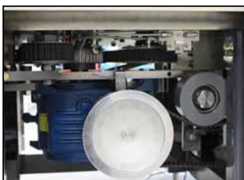
Moteur logé dans le bâtis